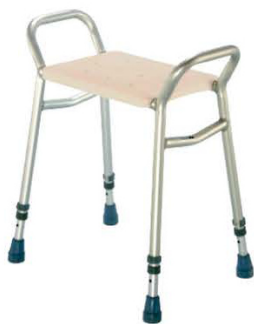
SEDAČKA DO SPRCHY 539 L