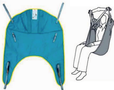
TRANSPORTNÍ ZÁVĚS KE ZVEDÁKŮM SEVERN POLY