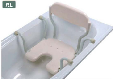
SEDAČKA DO VANY S OPĚRKOU ZAD BE06 W