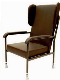
KŘESLO PRO KARDIAKY 5719