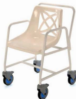
KŘESLO DO SPRCHY POJÍZDNÉ 4550