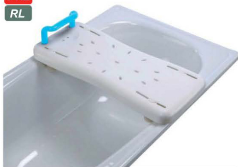
SEDAČKA NA VANU 4100