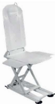
VANOVÝ ZVEDÁK KANJO