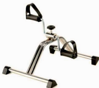
PEDÁLOVÁ POMŮCKA PRO REHABILITACI S63100