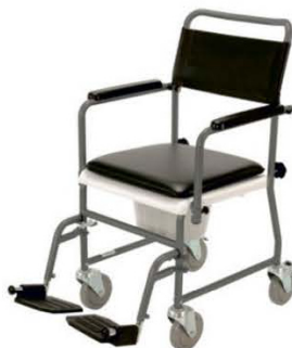
KLOZETOVÉ KŘESLO POJÍZDNÉ TSU - 2