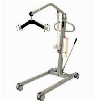
ELEKTRICKÝ POJÍZDNÝ ZVEDÁK EPL 175