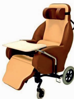
POLOHOVACÍ POJÍZDNÉ KŘESLO SELECTIS